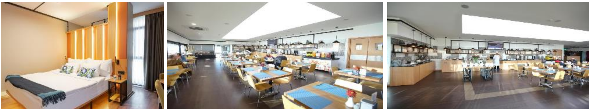
SARL TOURS SQUARE

Vous apprécierez un moment de détente dans le sauna, avec un massage moyennant des frais supplémentaires. Le tramway vous permettra d'accéder facilement aux attractions touristiques de la ville, comme le célèbre quartier de la vieille ville avec le palais de Topkapi, Sainte-Sophie et la Citerne Basilique. Vous rejoindrez le pont de Galata et le quartier animé de Karakoy en transports en commun.