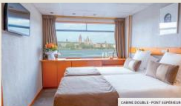
CABINE DOUBLE - PONT SUPÉRIEUR

NB : pas de service de blanchisserie à bord