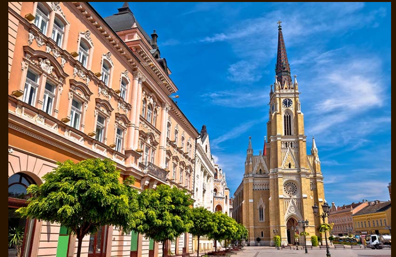
La forteresse de Petrovaradin, le centre ville