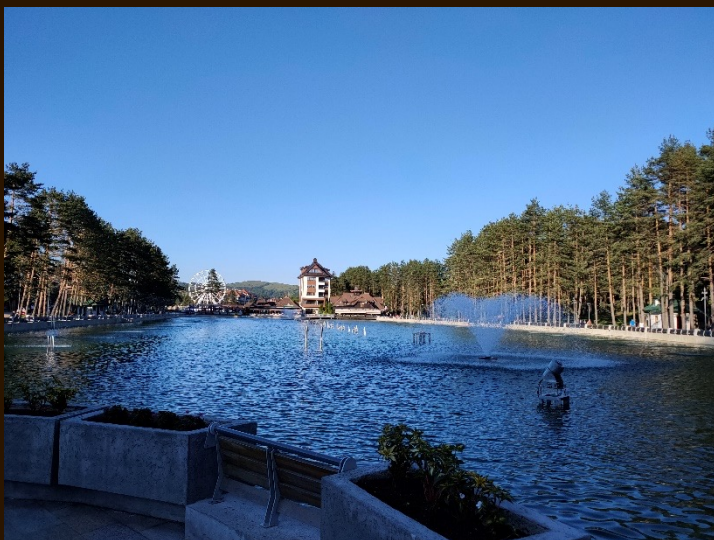
Zlatibor et son marché