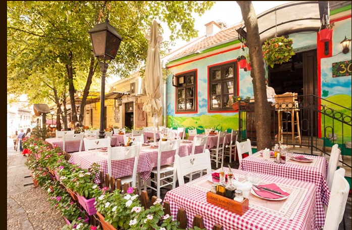
Le quartier bohème de Skadarlija