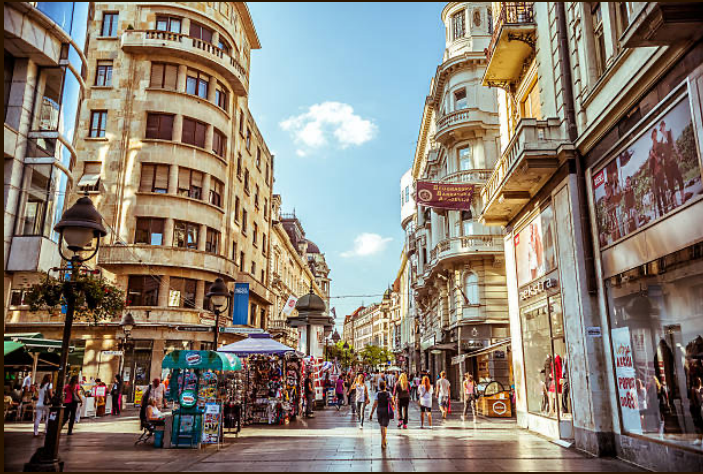
La rue commerçante Knez Mihailova