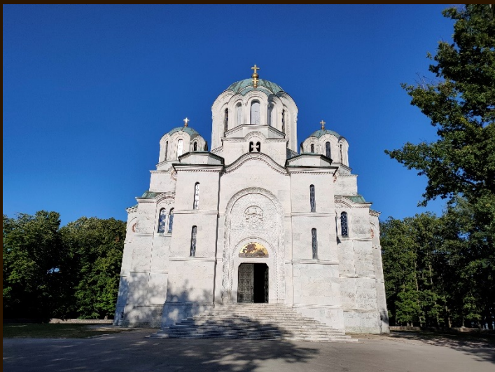
TOPOLA, le mausolée royal d'Oplenac