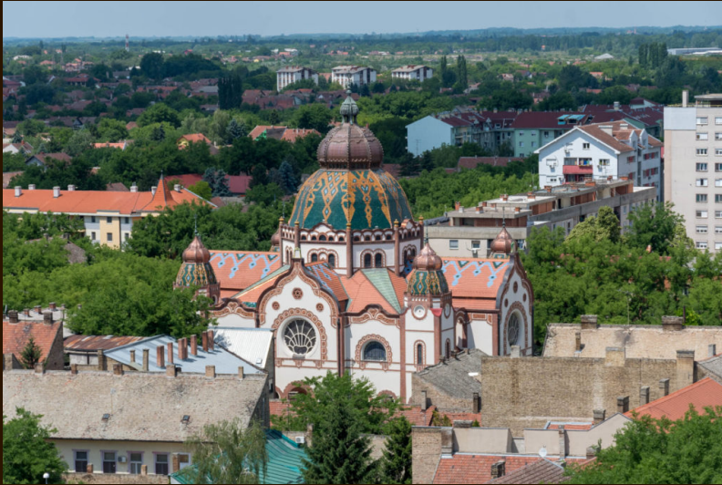
La synagogue, le Palais Reichl