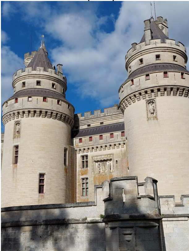
Le château de Pierrefonds

Le château que nous découvrons aujourd'hui a été sauvé des ruines grâce à Napoléon III qui confie la restauration à Viollet-le-Duc en 1857. Le Duc d'Orléans avait fait construire une demeure fortifiée en 1397 pour démontrer sa puissance et contrôler les échanges entre les Flandres et la Bourgogne. Le château sera démantelé en 1617 sur ordre du roi Louis XIII, puis sera racheté en ruine par Napoléon 1 er en 1810.